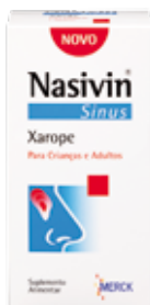
(2) Nasivin Sinus Xarope (7356402)