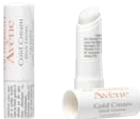
(2) Cold Cream Stick Labial