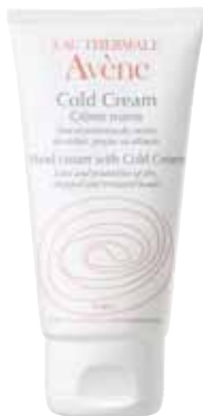
(1) Cold Cream Creme de Mãos