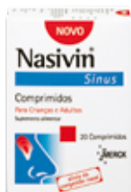
(1) Nasivin Sinus Comprimidos (7356410)