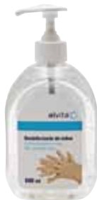
(2) 500 ml (6861864)